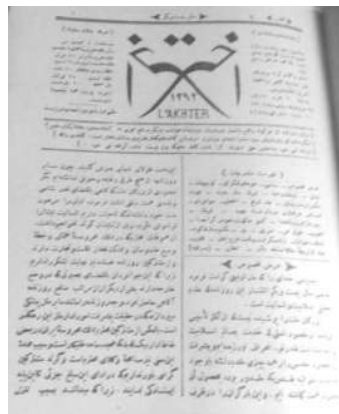
«Dxtar» –İstanbul 1875