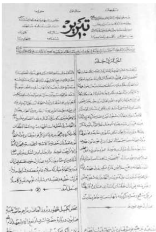
«Tabriz» tabriz 1879

قنید: اورقانلارین آدی، چاپ اولدوغو یئر و بیرینجی سایینین نشر تاریخی گؤستریلیر.