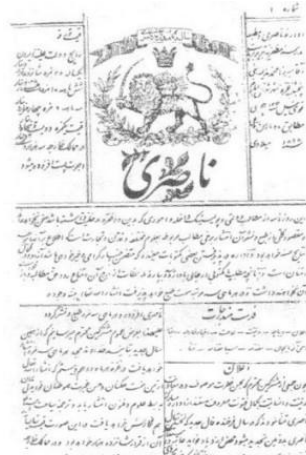
«Nasiri» Təbriz 1983