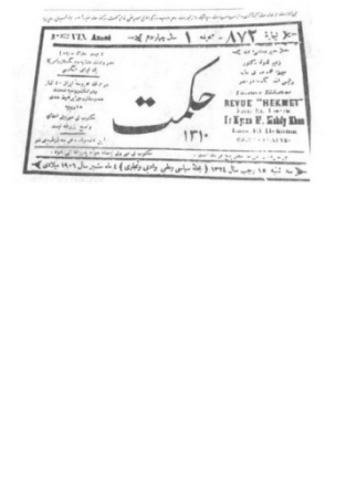
«Hekmat» -Qahirə Misir 1893