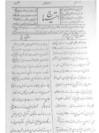
«Ehtiyac» – Təbriz 1898