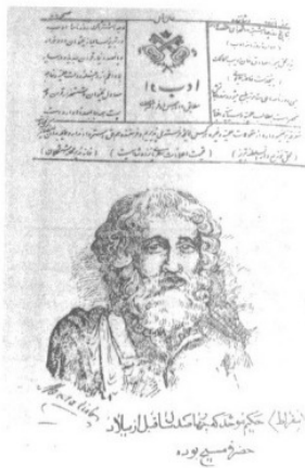
«Dab» – tabriz 1892